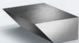
Chanfrein V inférieur