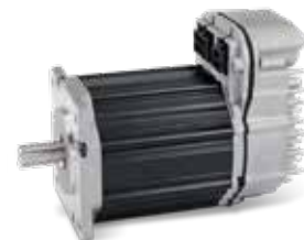
Moteur ClearPath avec amplificateur intégré