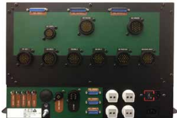
Amplificateur et boîtier de commande