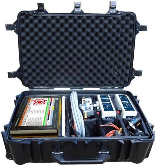
WeldScanner Validator mit Transportkoffer (Komplettpaket)

Der WeldScanner Validator validiert Lichtbogen-Schweißgeräte sämtlicher Hersteller gemäß der europäischen Norm EN 50504. Es bietet außerdem die volle Funktionalität des WeldScanners.